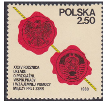
Πολωνία 1980 35η επέτειος της Πολωνο-σοβιετικής Συνθήκης Φιλίας